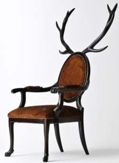
Fauteuil HYBRID de Merve KAHRAMAN, 2012.