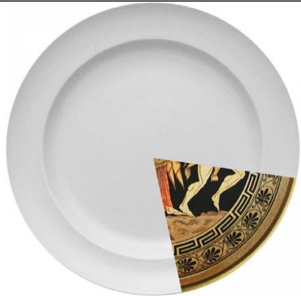
Assiette en porcelaine fine Hybrid , studio CTRLZAK pour Seletti , 2012.